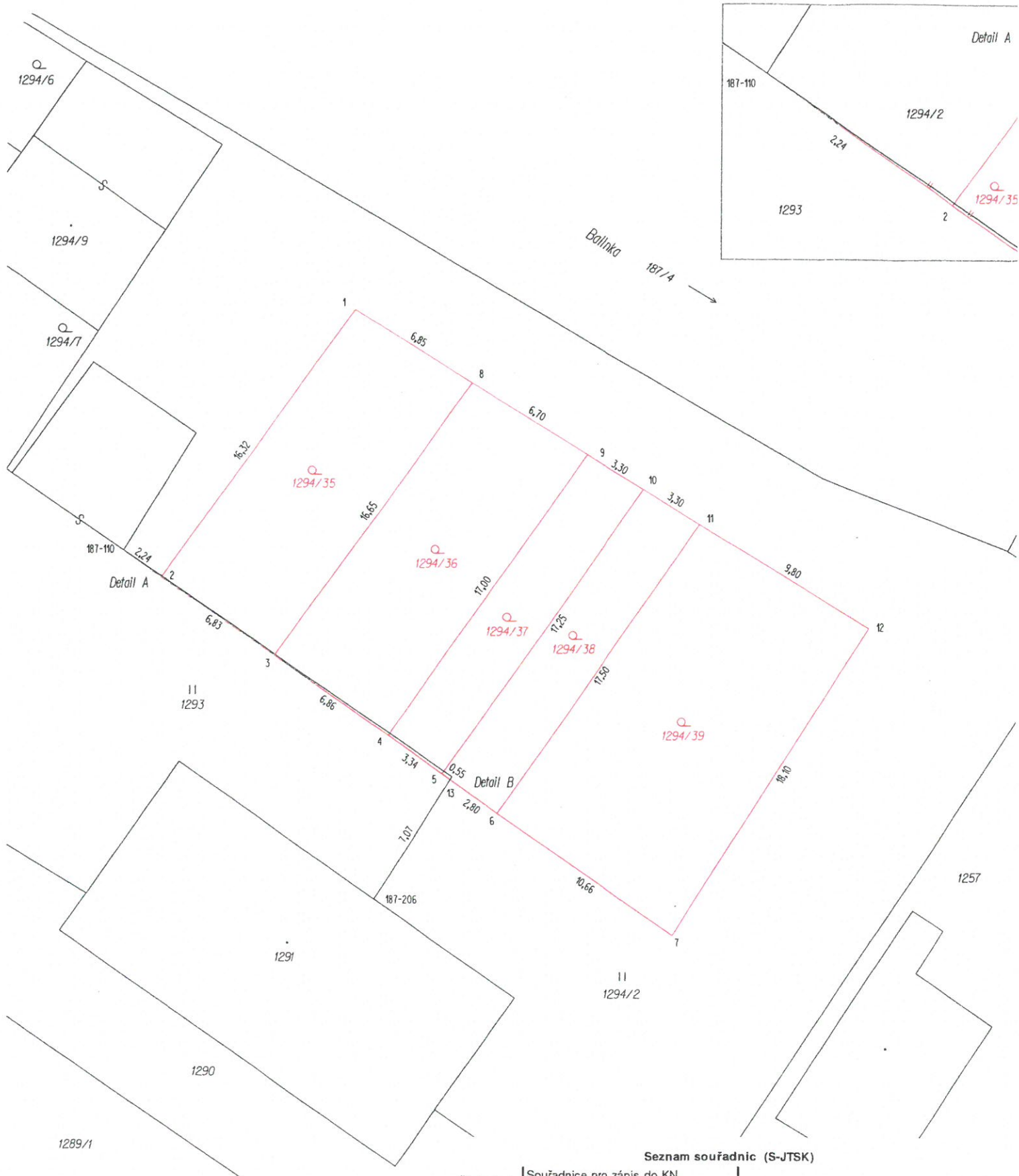
Seznam souřadnic (S-JTSK)